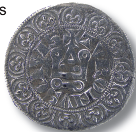
Een zilveren Tours.

Tussen de dorpen Well en Aijen is de aanleg van een hoogwatergeul gepland. Historisch kaartmateriaal wijst erop dat hier het middeleeuwse Huijs De Hildert moet liggen. De oudste vermelding van De Hildert is 1447 en het gebouw staat afgebeeld op vele kaarten uit de 16e, 17 en 18e eeuw. Dit gebeurde op verschillende manieren: soms als dorp of buurtschap, dan weer als kasteel, adellijk huis, klooster of abdij. Eén van de grote vragen is dan ook wat Huijs De Hildert nu eigenlijk was. Hadden de kaartmakers het verkeerd afgebeeld, fouten van anderen overgenomen of veranderde het in de loop der tijd van functie? Allemaal zaken die om een antwoord riepen. Deze en andere vragen zouden echter onbeantwoord blijven zolang de exacte plek een raadsel bleef.