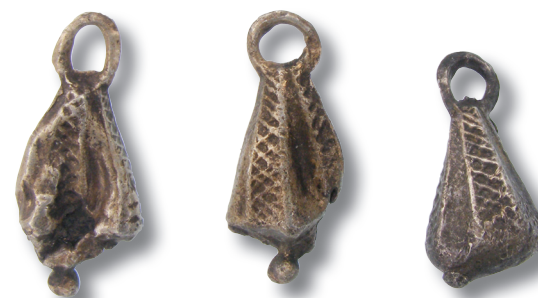
Pelgrimsinsignes, gevonden op De Hildert.

bleek een 16e eeuwse stenen huis van adellijke allure te zijn geweest, met een fundering van mergel, glas-in-loodramen en een leistenen dak. De binnenmuren waren waarschijnlijk bepleisterd. Twee mergelstenen waterputten zorgden voor de watervoorziening. Aardewerken kannen, kommen, kruiken, rijke drinkglazen en voedselresten wijzen op contacten met het Rijnland,