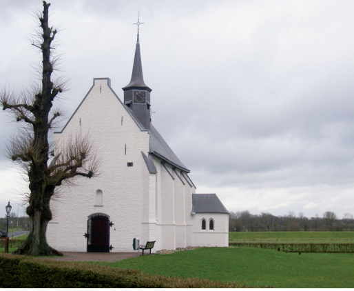
De huidige kapel van Aijen, gebouwd rond 1600.