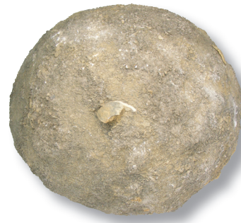
Kogel van grijze kalksteen voor een mortier of slingerblijde.