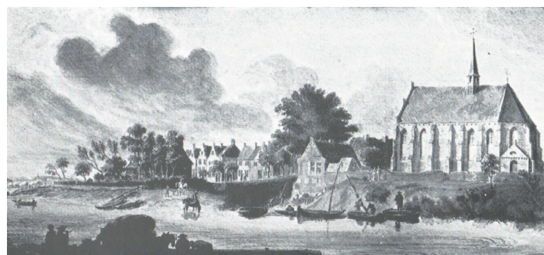
Well in 1739, getekend door Jan de Beijer.

Een groep regionale amateurarcheologen wilde wél zoveel mogelijk informatie van de vindplaats redden, en werkte in 2011 een plan uit voor een opgraving. Met subsidie van de Provincie Limburg en de gemeente Bergen lukte het om in maart 2012 de volledige resten van het gebouw op te graven. Huijs De Hildert