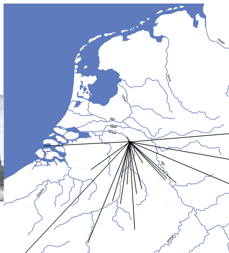
Handelscontacten vanuit De Hildert.

zoals Siegburg, Langerwehe, Keulen/Frechen en Raeren, maar ook met de Ardennen, Zuid-Limburg (St. Pietersberg), het Belgisch/Nederlands kustgebied en zelfs Noord- en Midden-Frankrijk. De huidige grindweg langs De Hildert stamt uit de Middeleeuwen en liep tot aan de Maas, waar een losplaats was om de mergel en het leisteen van boten af te laden. Mergel werd ook verwerkt in een vaste brug, die over een sloot langs de weg was gebouwd. Stuifmeelonderzoek geeft aan dat De Hildert is gebouwd in een gebied vol akkers en weilanden, met hier en daar een plukje heide of moeras. Waarom werd dan gekozen voor een plek halverwege Well en Aijen, op de flank van een zandrug met het risico op overstromingen?