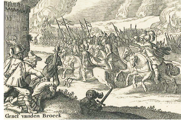
Doortocht van troepen door het Land van Kleef.

Aijen liet verwijderen en 'in zijn huys in den Hildert in zinn bywesen heeft doen verbranden'. De religieuze kwestie zou één van de redenen zijn voor het ontstaan van een opstand tegen koning Filips II van Spanje. Ook het hertogdom Gelre, waar de heerlijkheid Well toe behoorde, zou hier aan deelnemen.