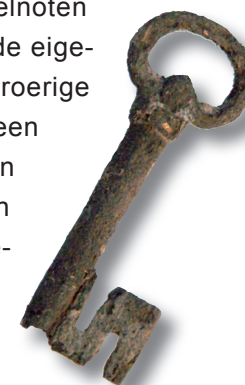
Sleutel uit een waterput van Huijs de Hildert.

De vondsten geven inzicht over de bewoners van Huijs De Hildert. De adellijke uitstraling van het gebouw, deftige lepels en drinkglazen wijzen op rijke bewoners. Zij hadden echter geen bijzonder rijke tafel en aten voornamelijk boekweitpap, rundvlees en dronken wijn, maar het menu bestond ook uit vis- en schelpgerechten, aangevuld met een diversiteit aan fruit en noten, zoals kersen, peren, bramen, hazelnoten en walnoten. De enige bron over de eigenaar van De Hildert dateert uit de roerige 16e eeuw en heeft betrekking op een Beeldenstorm die door de heer van Well werd toegestaan. Adriaan van den Bylandt moet zich voor het gerecht verantwoorden waarom hij heiligenbeelden uit de kapel van